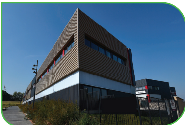
Innovespace 155 155 rue George Stephenson