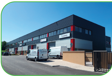
Innovespace 89 89 rue George Stephenson